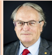
Prof. Dr. Stanley Whittingham Premio Nobel de Química 2019